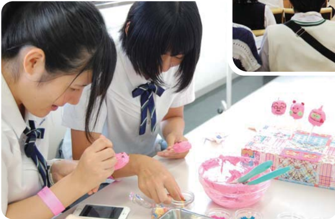
ロリポップづくり

8/9のオープンキャンパスは台風の影響のため延期となり、8/24に開催しました！ 雨にもかかわらず、たくさんの方がお越しくださいました。